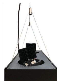
Système de suspension avec filins en triangulation